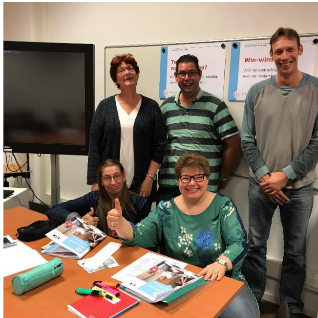
Figuur 1 Training testpanel 2019